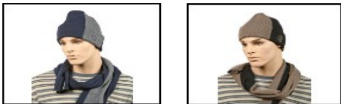
9952015 Набор унисекс (шапка+шарф+перчатки) Gianni Conti 60% шер. 20% нейлон.20 ангора