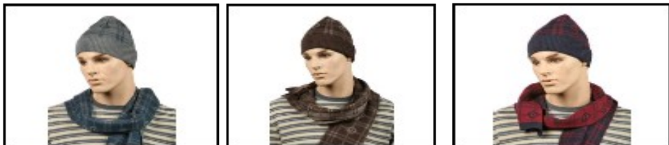
9972005 Набор мужской (шапка+шарф+перчатки) Gianni Conti 50% шер., 50% акр.