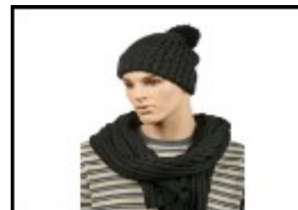
9812014 Набор мужской (шапка+шарф) Gianni Conti 60% шер. 20% нейлон.20 ангора